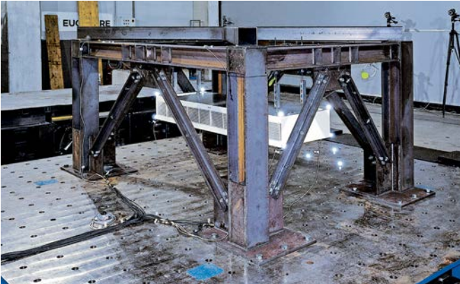
Prove su ventilconvettori sospesi