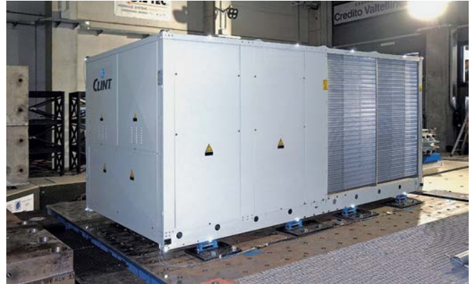
Prove su refrigeratori (chiller)