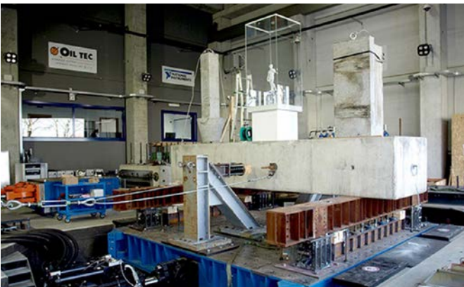
Prove su vetrine museali e contenuti artistici