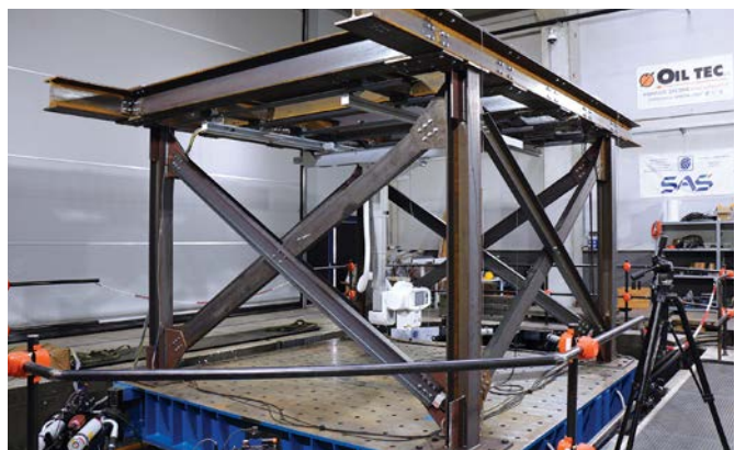
Prove su attrezzature elettromedicali