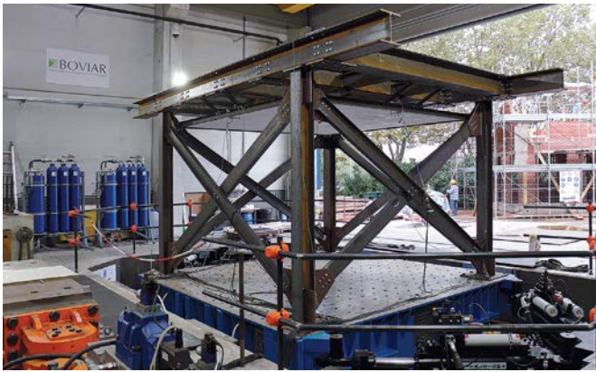
Prove su controsoffitti