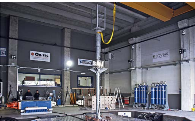
Prove su componenti per impianti elettrici