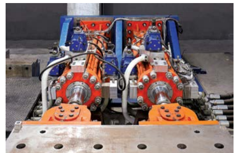
Sistema di prova per smorzatori (DTS) Damper Testing System