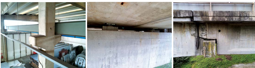
Alcune immagini raccolte durante le ispezioni di ponti (in alto), capannoni (in basso a sinistra) e chiese (in basso a destra), utilizzando i droni della flotta di EUCENTRE.