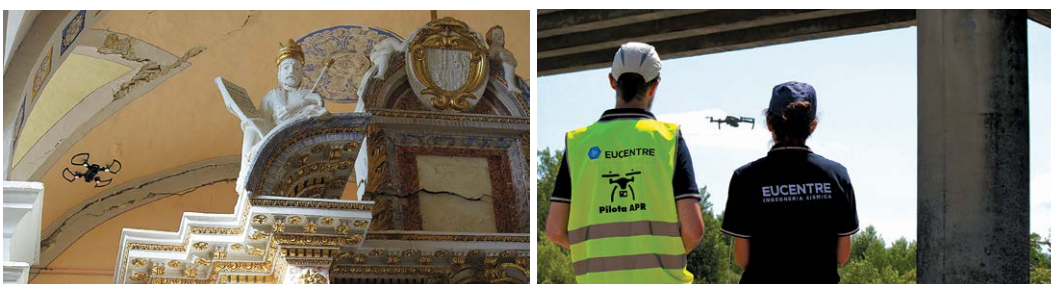
Alcuni mezzi e personale dell'unità droni di EUCENTRE impegnati nell'ispezioni di ponti.